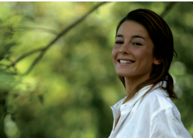
Image de soi estime de soi